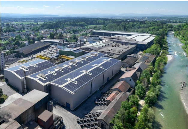
Mit rund 4500 Modulen ist die im vergangenen Jahr gebaute Anlage auf dem Stahlwerk Gerlafingen die zweitgrösste der rund hundert Photovoltaikanlagen der ADEV.