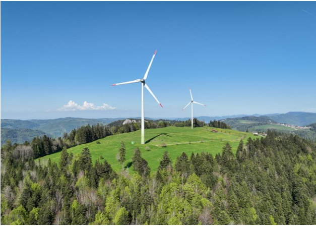
Die beiden Windturbinen der ADEV in St-Brais im Kanton Jura liefern insbesondere auch im Winter zuverlässig Strom.