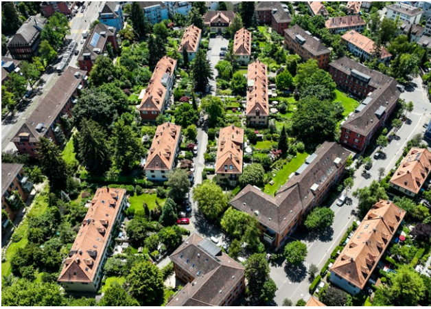
Oben: Der Wärmeverbund am Zanggerweg mit einer Heizzentrale im Kindergarten ist eine zukunftsgerichtete Heizlösung der ADEV mitten in der Stadt Zürich.

«Aufgrund unserer gemeinsamen Werte ist die CoOpera für die ADEV eine perfekte Partnerin bei der Finanzierung unserer nachhaltigen Energieprojekte.»